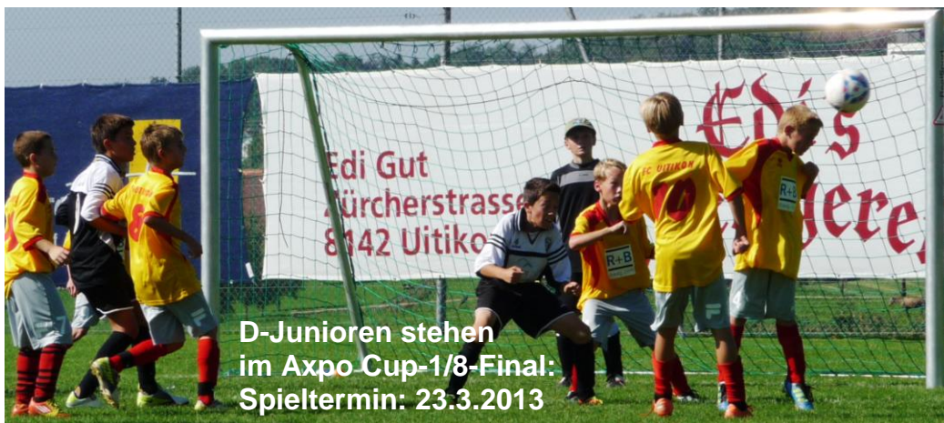
D-Junioren stehen im Axpo Cup-1/8-Final: Spieltermin: 23.3.2013

einiger Zeit intensiv ein. Es darf nicht sein, dass wir unsere ehrenamtlichen Stunden mit immer mehr Notfallplanung, Spielverschiebungen und Administration verträdeln. Nein, wir wollen sie sinnvoll in den Dienst der Jugend unserer Gemeinde stellen und den Dorfverein weiter vorwärts bringen . Deshalb schreiten wir zielorientiert voran und mit dem entsprechenden Wohlwollen der Bewohner unserer Gemeinde können die ersten Arbeiten für den zusätzlichen Platz bereits im Frühjahr 2013 beginnen.